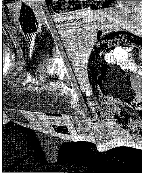
Nach intensiver künstlerischer Arbeit präsentieren die Schüler der WBS ihre Werke im Quiddezentrum.

Neuperlach · Unter dem Motto »HEAD - HAND - & - HEART« steht die Kunstausstellung der Städtischen Wilhelm-Busch-Realschule, die vom 29. Juni bis 11. Juli im Quiddezentrum (Quiddestraße 45) zu sehen ist. Die Verbindung von Kopf, Hand und Herz ist gerade in der modernen Kunstpädagogik ein wichtiger Grundge-